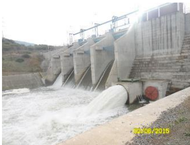
Presa Auxiliar, aguas abajo

Con fecha 01.06.2015 la cota del nivel de agua era la 262,95 msnm y descendió al 30.06.2015 a la cota 262,79 msnm.