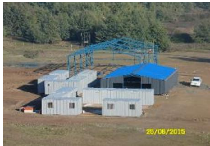
Trabajos Área Instalación de Faenas Central Hidroeléctrica