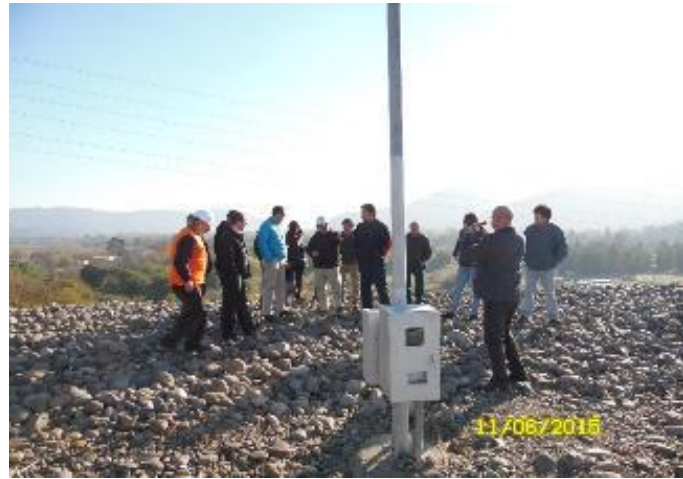
Profesionales de INDAP en Muro principal