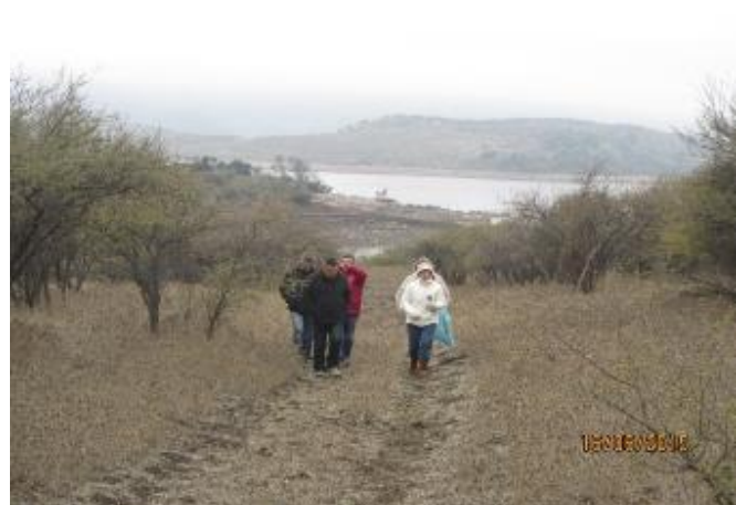
Participantes de la mesa de trabajo de conectividad, recorriendo la huella que une Colonia Quinta con Chimbarongo

Este recorrido involucró recorrer una huella de camino existente, por el borde poniente del embalse. Son 8 km de sendero, con pendientes de gran intensidad, con vista a la cubeta, en todo su trayecto, lo que significa un gran impacto visual y estético.