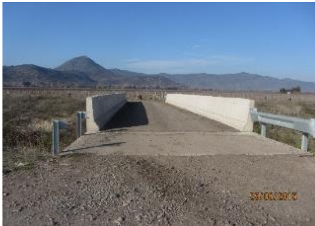
Puente Interpredial Km 4,640 usado por dueños de predios adyacentes al canal matriz Nilahue tramo II

Los resultados de la actividad en terreno verifican los desplazamientos que realizan vehículos particulares por los puentes interprediales, lo que les permite tener accesos a las rutas públicas que conducen a las localidades de Chépica, Teno, Curicó, Chimbarongo y Santa Cruz, entre otras.