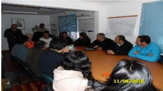
Personal de INDAP durante la presentación del Proyecto

Durante el mes de junio, se destaca la visita de Autoridades de INDAP a nivel Regional y a Nivel Nacional El Jefe de la Asesoría atiende las consultas de los profesionales de INDAP durante una presentación del proyecto en las oficinas del Inspector Fiscal.